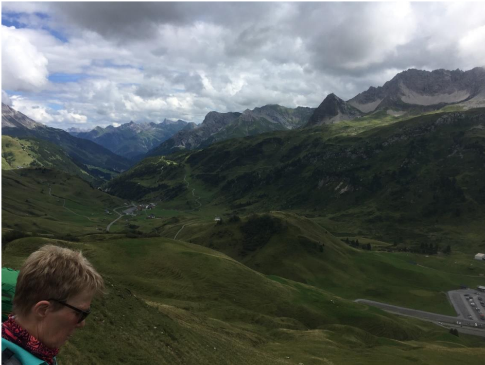
Blick vom Hochalppass auf den Hochtannbergpass und Warth

Auf dem Hochalppass eröffnete sich eine tolle Landschaft – der Widderstein als imposanter Gipfel, in einiger Entfernung die Widdersteinhütte und unter uns im Tal der Skiort Warth und der Hochtannbergpass. Die Kühe hatten dem Weg ganz schön zugesetzt und so mussten wir zwischen den Gräben balancieren. Bald ging es steil berab.