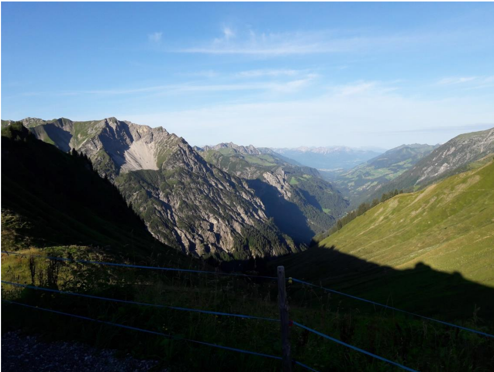
Blick von der Biberacher Hütte ins große Walsertal