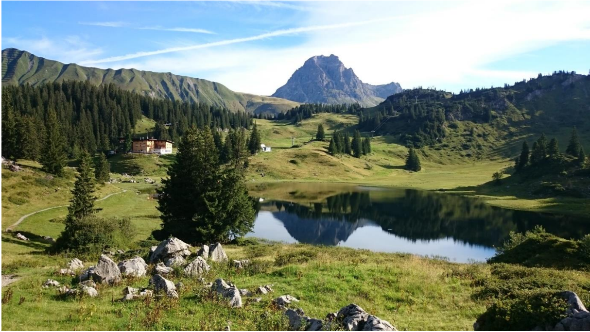
Hotel Körbersee mit Widderstein im Hintergrund