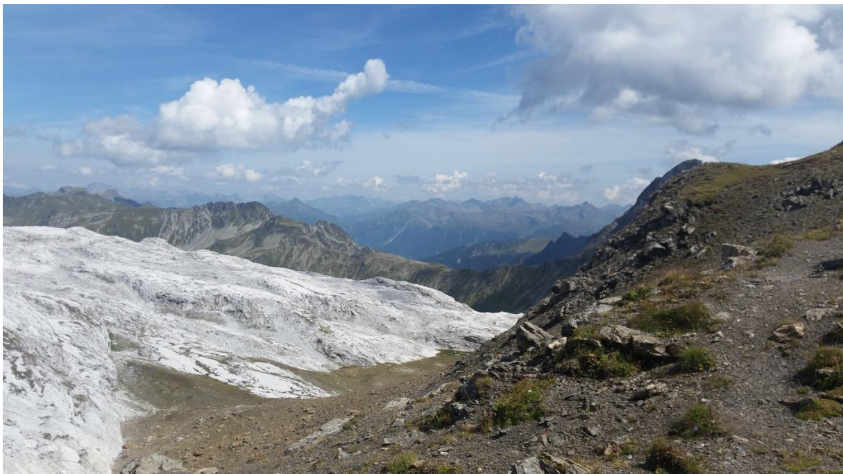
Kein Gletscher sondern verschiedene Gesteinsschichten kurz vor dem Rätschenjoch