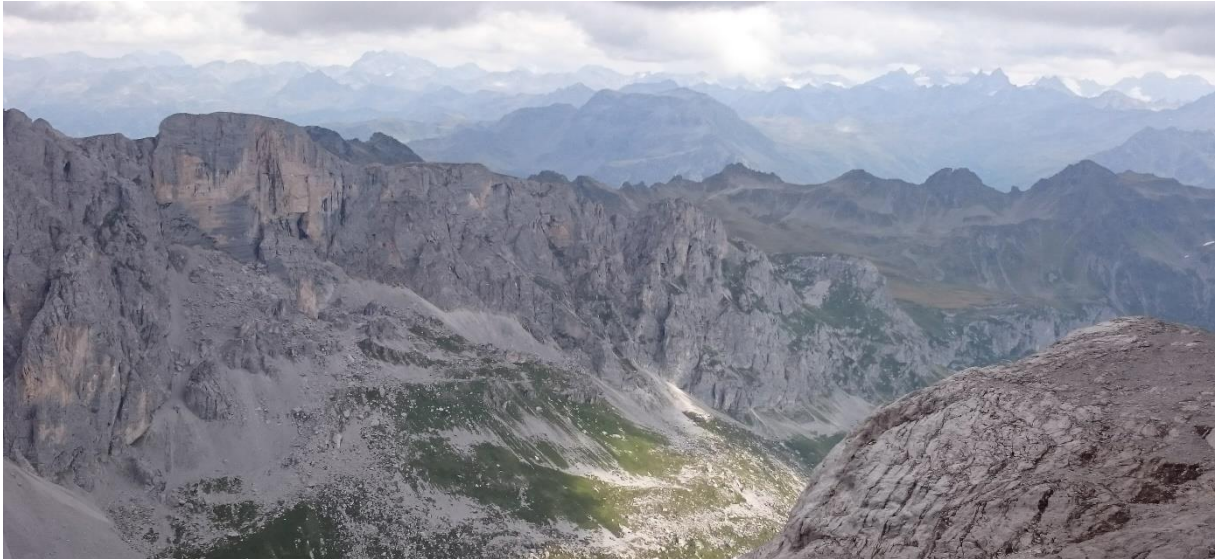
Blick von der Sulzfluh