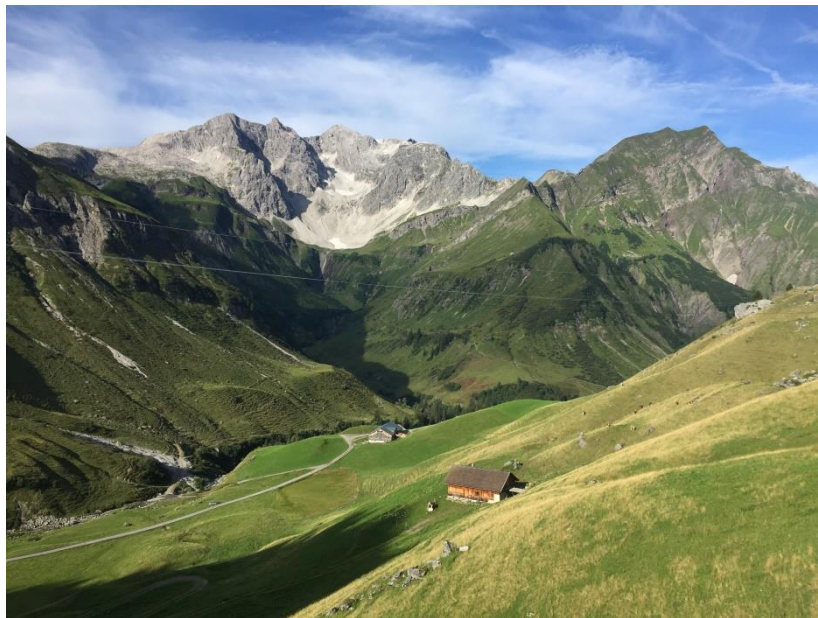
Blick auf vor uns liegende Etappe hinauf zum Fürgele