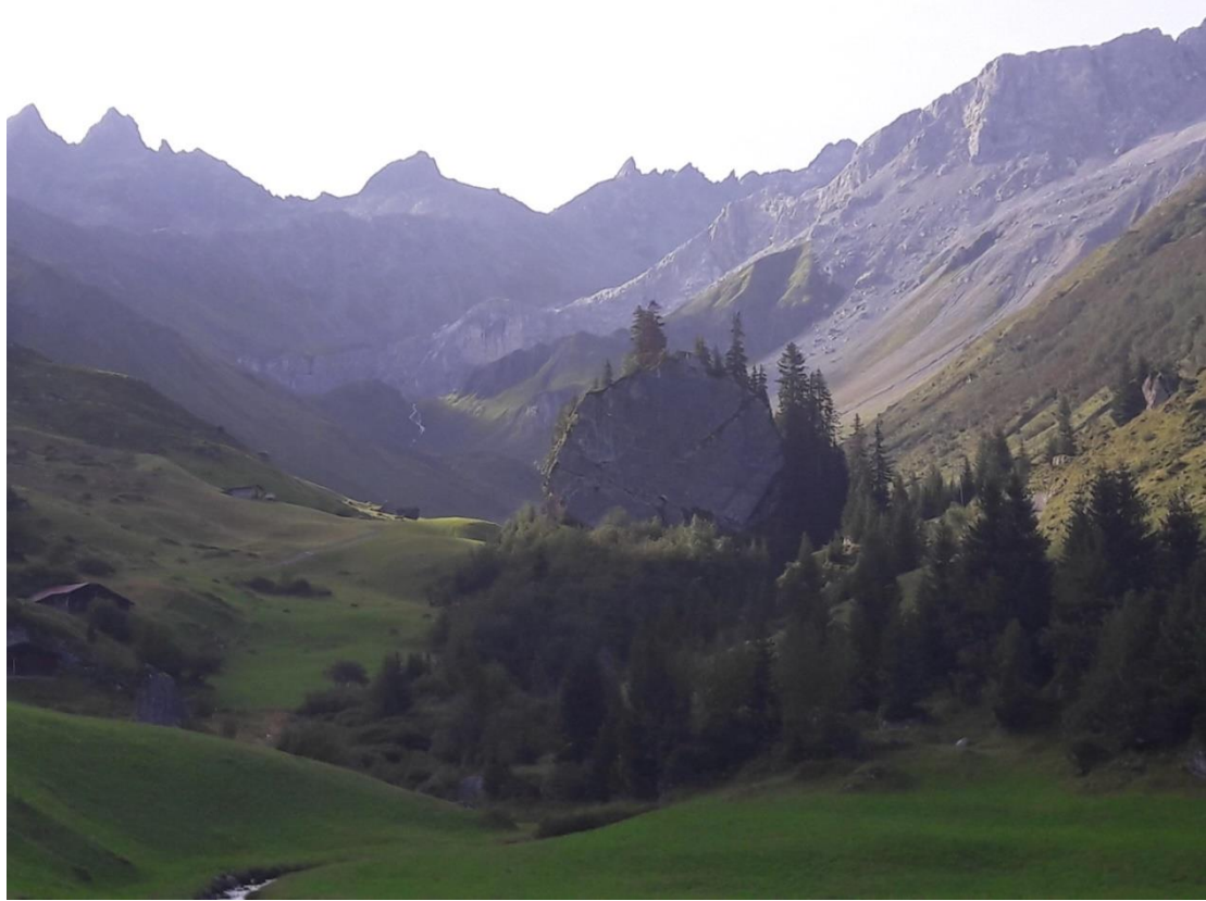
Durchs Tal von Antönien zum Rätschenjoch