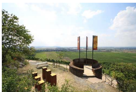
terroir f Iphofen