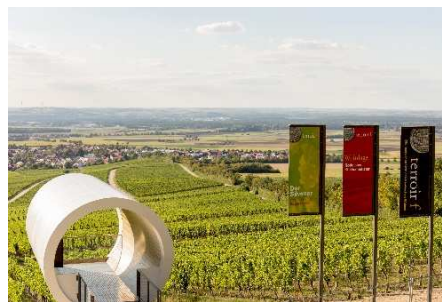
terroir f Rödelsee