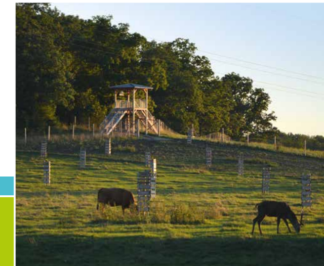
Blick auf den Aussichtsturm über die Hutungsfläche

Die Hutungsfläche in Hellmitzheim wird von den Weidetieren aktiv gestaltet. Durch die Beweidung entsteht eine strukturreiche Wiese (Kurzgras – Hochstauden). Sowohl das Rotwild, als auch das Gelbvieh, (alte Hausrindrasse) nutzen den eingezäunten Wald und schaffen hier durch Verbiss und Tritt Strukturen, die im Wirtschaftswald so kaum noch zu finden sind. Am Waldrand bildet sich durch die Beweidung eine halboffene Landschaft – Lebensraum für zahlreiche Schmetterlingsarten. Auf den Liegeflächen und Trittstellen entstehen durch die dauernde Nutzung der Tiere Rohbodenstandorte, die z. B. von verschiedenen Insektenarten, wie Sandbienen, besiedelt werden. Dunghaufen als Nahrungsquelle locken ebenfalls Insekten an. Die Wasserstelle für die Weidetiere ist gleichzeitig ein Amphibienhabitat, z. B. für die Gelbbauchunke. Die alten Huteeichen sind reich an Spalten und Höhlen. Halsbandschnäpper und Fledermäuse finden dort Unterschlupf und auf der insektenreichen Hutefläche reichlich Nahrung.