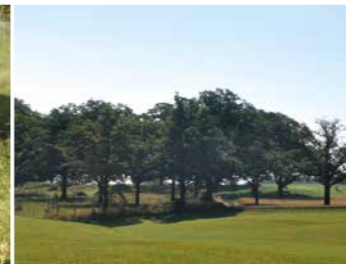
Hutewaldrest mit ca. 200 Jahre alten Eichen