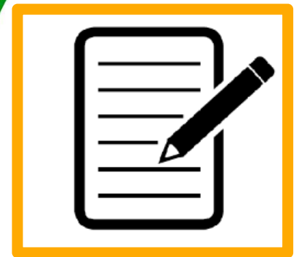
Kontaktdaten dalassen! per Luca-App oder Formular