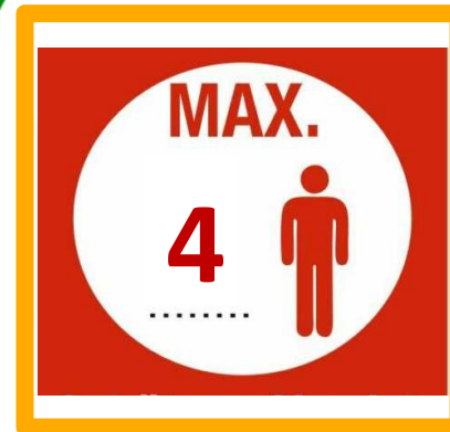
Max. 4 Gäste im gesamten Innenraum