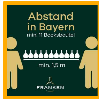
Mindestabstand 1,5 m