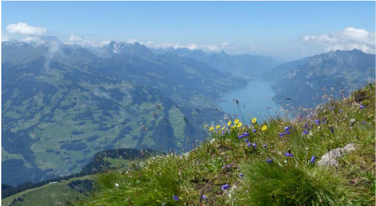
Gipfelblick vom Alvier, 2343m, nach Westen zum Glärnisch und Walensee.