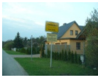
Zentendorf, östlichster P.