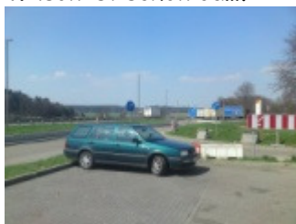
Mein zuverlässiger Begle...