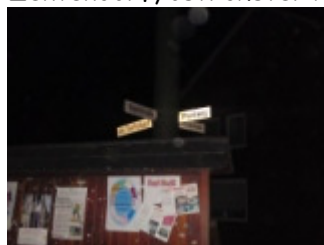
Selfkant, where are you?