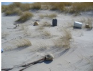
Wilson ist schon da....

So, die halbe Seite ist voll. Die Reise war eine weitere Bestätigung für mich wie schön es, trotz vieler unnatürlicher Verhaltensweisen von uns Menschen und unserem Umgang mit der Natur dieser Erde, in Deutschland ist. Bei Rückfragen ruhig anrufen: 0173-7337957 oder jochen.goelitz@gmx.de . HERZ-lichst, JoGö.