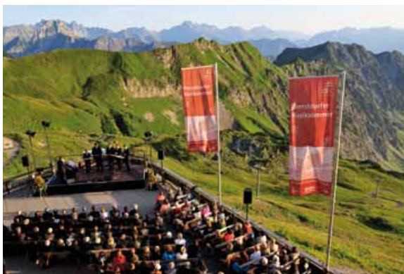
Serenade in 2000m Höhe, Nebelhorn