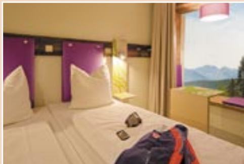
Zimmer Explorer Hotel