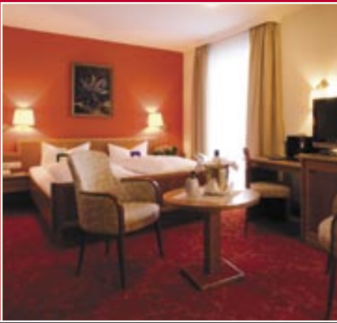
Zimmer Hotel Mohren ****