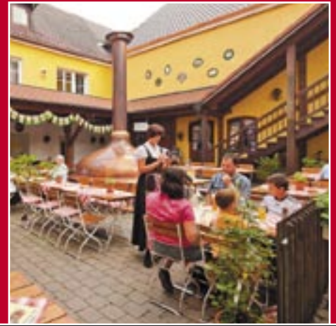
Biergarten Brauerei-Gasthof Hotel Post ***