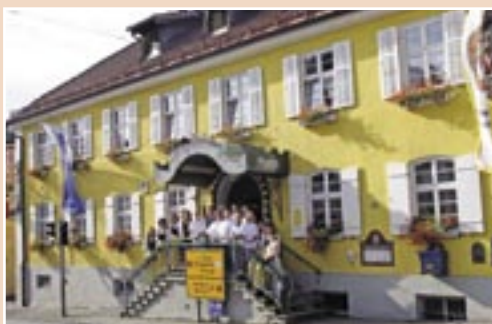
Brauerei-Gasthof Hotel Post ***

Übernachtung inkl. Halbpension ab € 46,-* pro Person