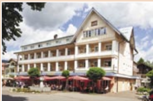
Hotel Mohren ****

Übernachtung inkl. Halbpension ab € 46,-* pro Person