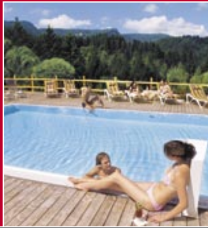
Pool Hotel Oberstdorf ****