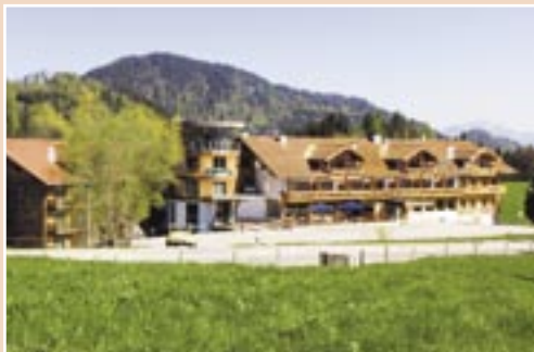
Hotel Oberstdorf ****